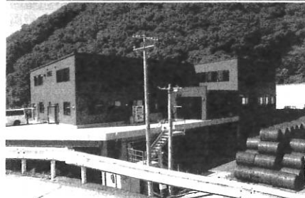
関東工場(上)と新本社屋